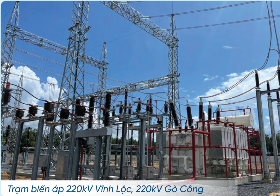
Trạm biến áp 220kV Vĩnh Lộc, 220kV Gò Công