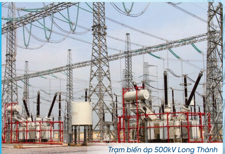
Trạm biến áp 500kV Long Thành